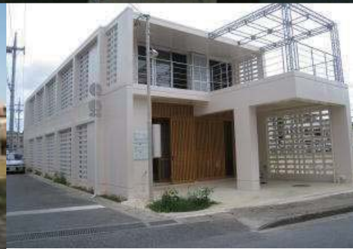
写真：伊志嶺敏子一級建築士事務所（宮古島の県営平良団地、郊外型環境共生住宅、市街地型環境共生住宅）