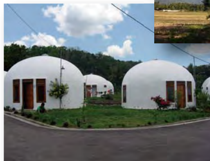
←とっても不思議な ドーム住宅の村探検