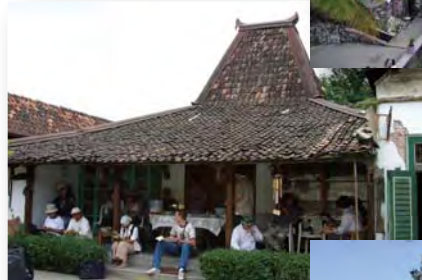
←ジャワ島の 伝統的民家を学ぶ