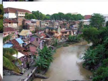
住宅密集地 カンボンの探検→