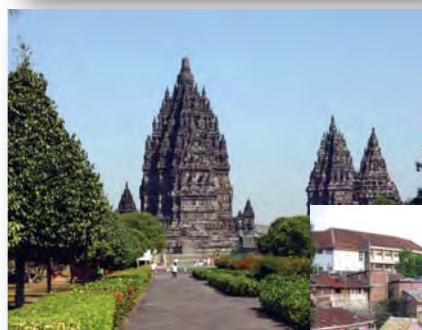
←感動の世界遺産 ブランバナン遺跡