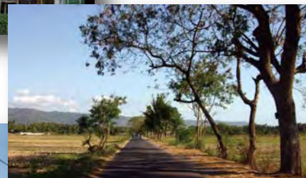
美しい インドネシアの農村→